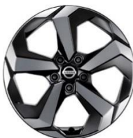
N-Connecta & Tekna 18" alufælge (235/55 R18)