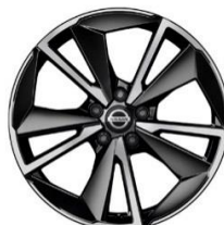
Tekna+ Ekstraudstyr til N-Connecta & Tekna 19" alufælge (235/50 R19)