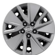
Visia 17" stålfælge (215/65 R17)