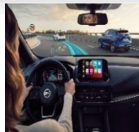
ProPILOT med Navi-link