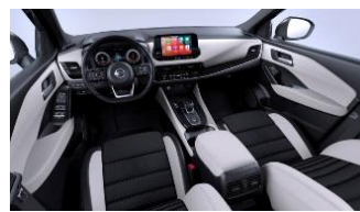
Ekstraudstyr til Tekna Lysegrå - Stof og kunstlæder Monoforme sæder