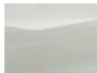
Ceramic Grey (KBY)