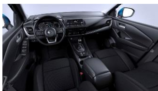
Visia & Acenta Sort - Stof Monoforme sæder