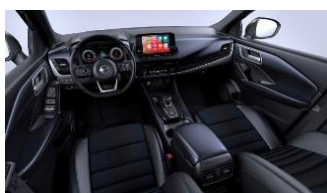
Tekna Ekstraudstyr til N-Connecta Blå og sort - Stof og kunstlæder Monoforme sæder