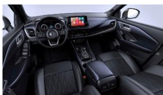
Tekna+ Sort - Premiumlæder Monoforme sæder