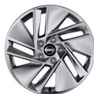
Acenta 17" alufælge (215/65 R17)