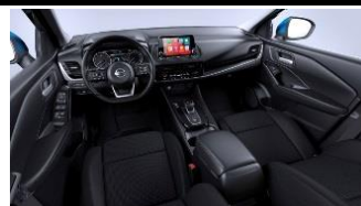
N-Connecta Charcoal - Stof Monoforme sæder