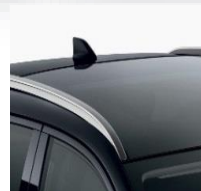
Glastag & tagrælinger