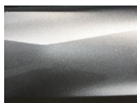
Grey Metallic (KAD)