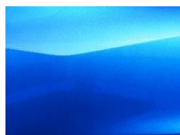
Magnetic Blue (RCF)