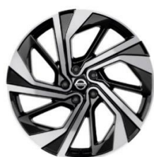
Ekstraudstyr til Tekna+ 20" alufælge (235/45 R20)